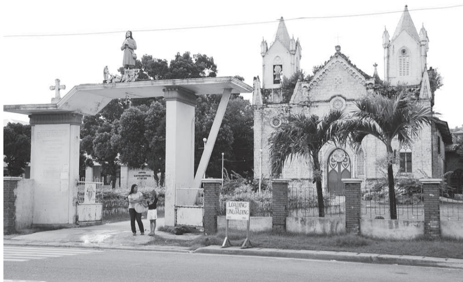
◆ 圣希道堂深受哥德式建筑的影响，以珊瑚石建成；混凝土制成的钟楼是后来加上的。圣堂入口处立着该堂主保圣希道（St Isidor Labrador）态像。圣人生于1070年的西班牙马德里，家境贫穷；圣人生前善待穷人和动物，于1130年5月15日逝世。1619年5月2日教宗保禄5世列他为真福，1622年3月12日由教宗额我略十五世列入圣品，是农民主保。

堂只建了墙体而已。一直到1886年，这座圣堂才正式全面完工，并由教区代表于1886年10月25日主持祝圣开幕礼。