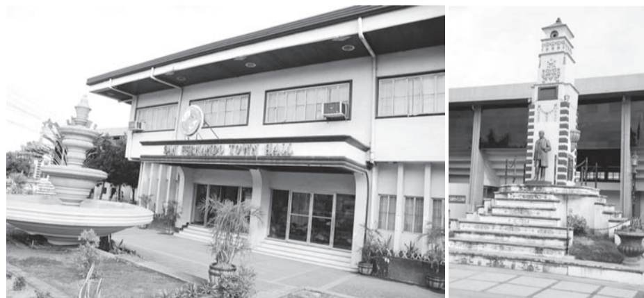
◆ 圣费南多镇的市政厅（左图）及纪念菲律宾国父黎刹的雕像（右图）。

圣费南多镇距离宿雾市约30公里，是个地方小镇；这里除了一般的住家外，就只有地方政府的办事处。