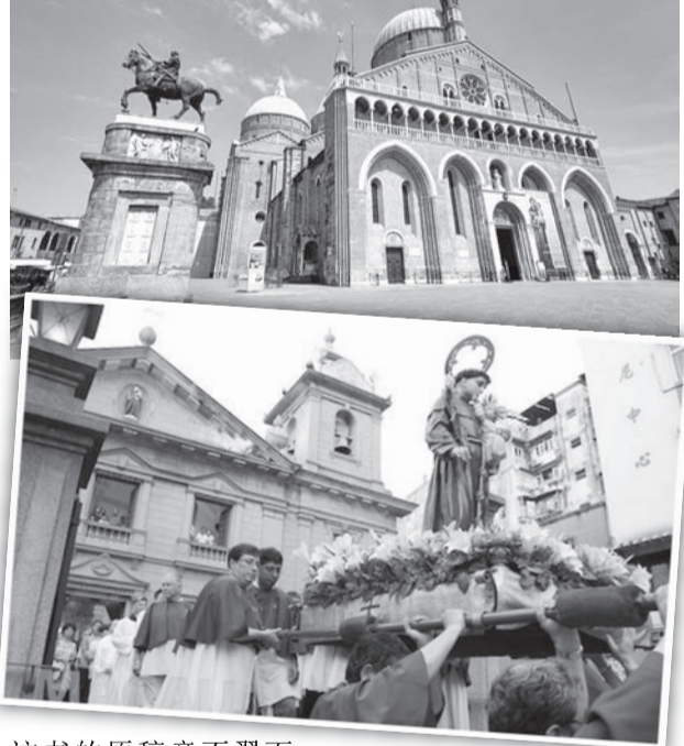
■ 位于意大利巴都亚的圣安多尼大殿。

这书的原稿竟不翼而飞，失窃了；圣人深感不安，可是他立刻虔诚地祈祷。圣人的祷告是特别易得俯顺的，是故所失的稿本很容易便找回来了。