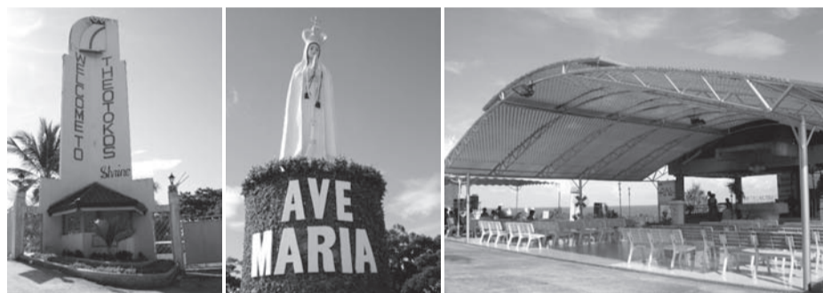
◆ 卡卡尔镇著名的天主之母朝圣地Theotokos Shrine。

此朝圣地位于当地一座小山顶上。山上建有一间开放式的小教堂，能让朝圣团在此举行弥撒圣祭。此处有尊法地玛圣母态像，圣母面向大海，有如守护着千岛之国的菲律宾。此法地玛圣母圣像在1992年9月9日，由当时宿雾总教区的维达尔枢机（Ricardo Cardinal Vidal）祝福，并于四年后，当局正式宣布为宿雾总教区的朝圣地之一；每月的13日，这里将会举行一台黎明弥撒。