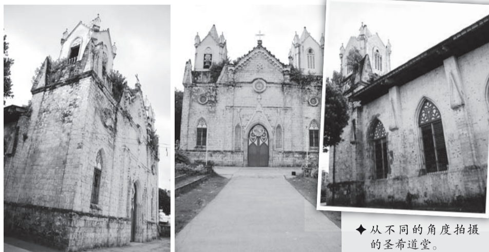
◆ 从不同的角度拍摄的圣希道堂。

圣希道堂开始是在Fr Miguel del Burgo的倡议下，由西班牙籍工程师兼建筑师Domingo de Escondrillas负责绘图建设，于1870年12月开始动工。惟在1876年时，建堂工程因资金不足被迫停工。后来，当Fr Emiliano Diez接任本堂时，圣